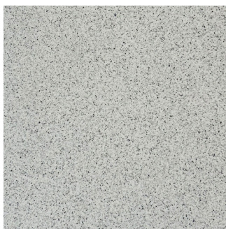
NORDIC (Gris moyen)

30 x 30 cm (12 x 12) CODE: LQ.SP.NLT.1212