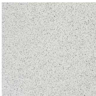
NORDIC LIGHT (Gris pâle)

30 x 30 cm (12 x 12) CODE: LQ.SP.SAH.1212