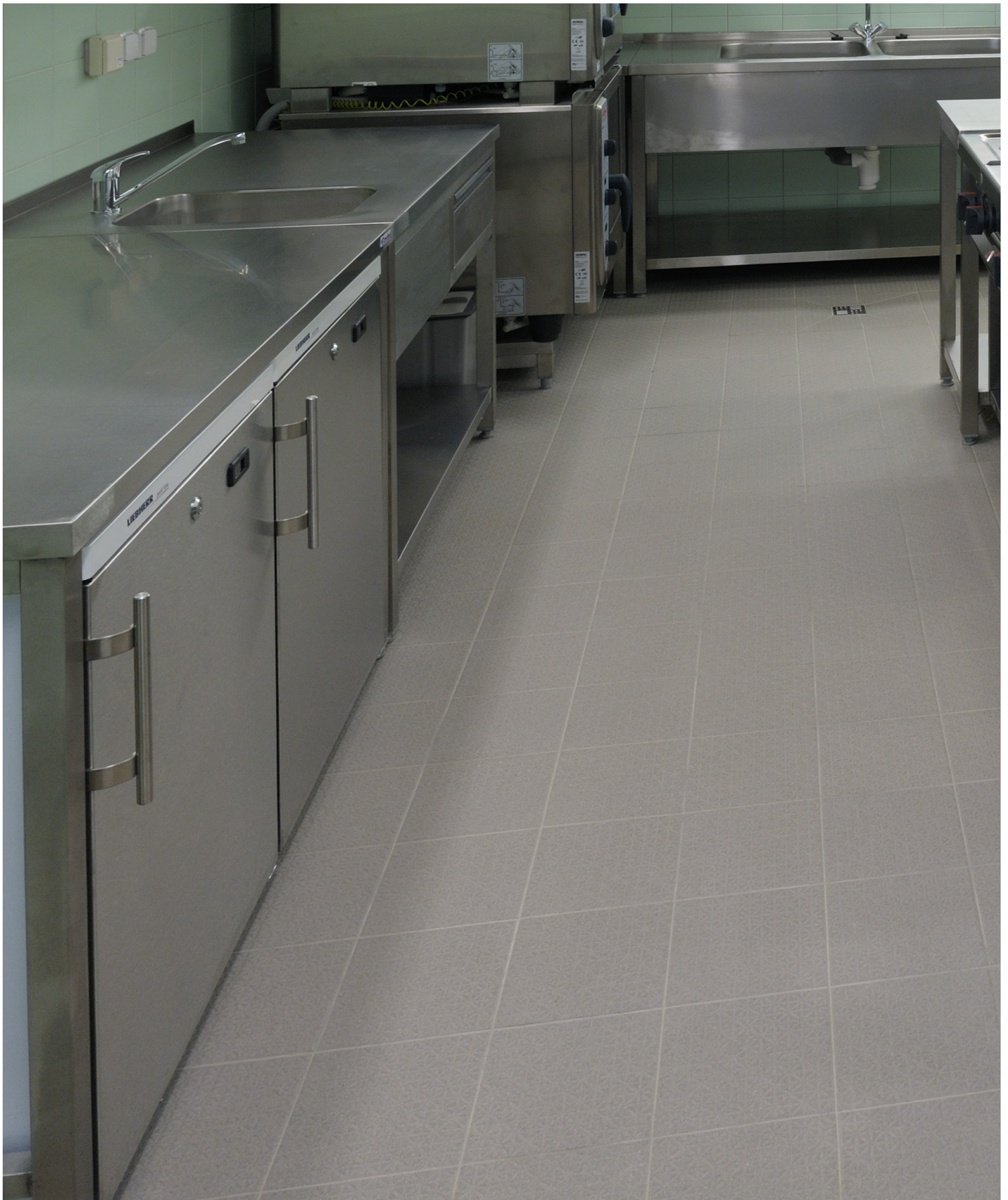
SÉRIE SPECTRA Nordic (Gris Moyen) Fini anti glissement