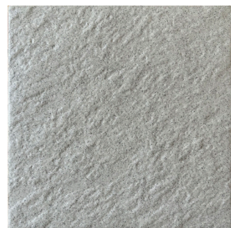
NORDIC (Gris moyen)

20 x 20 cm (8 x 8) CODE: LQ.SP.ANT.0808SR7