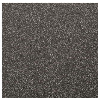
RIO NEGRO (Noir)

30 x 30 cm (12 x 12) CODE: LQ.SP.ANT.1212